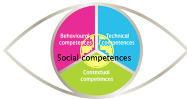
Рисунок 4 - Модифікація моделі "Око" з вимогами до компетенцій проектних менеджерів Міжнародної асоціації управління проектами для використання в наступних версіях стандарту

Пропонується модифікувати цю модель додаванням «зіниці» – фокусу на загальнолюдських цінностях, дотриманні професійної етики та прихильності принципам соціальної відповідальності при веденні бізнесу. У такому випадку пропонується розглядати модель компетенцій у вигляді як традиційних елементів компетенцій (з можливими змінами та доповненнями в майбутньому), так і ввести додатковий елемент – «Соціальна компетентність», який, як мінімум, повинен включати такі елементи: захист загальнолюдських цінностей; дотримання професійної етики; соціальна відповідальність при веденні бізнесу (рис. 4).