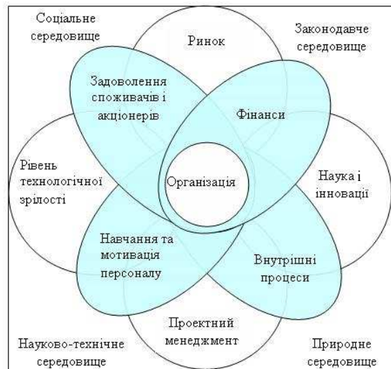
Рисунок 1 - Взаємодія організації із зовнішнім оточенням

Конкретні функції управління тісно пов'язані із специфікою підприємства і основними сферами його діяльності [12].