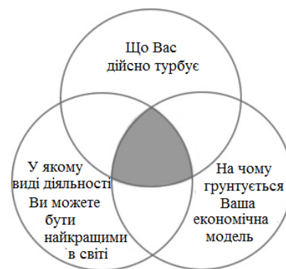
Рисунок 2 - «Принцип їжака» Коллінза

З іншого боку, робота проектного менеджера спрямована на досягнення ним успіху у проектах. Сутність цього положення спробував відшукати Джим Коллінз у своїй роботі «Від хорошого до великого» [17]. У роботі наведено принцип «їжака», як невід'ємної характеристики успішності на ринку, і який суттєво пов'язаний з усіма складовими проектною діяльністю (рис. 2).