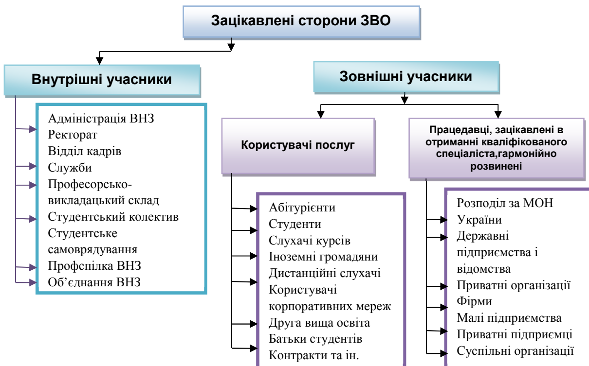
Рисунок 3 – Ієрархія зацікавлених сторін ЗВО