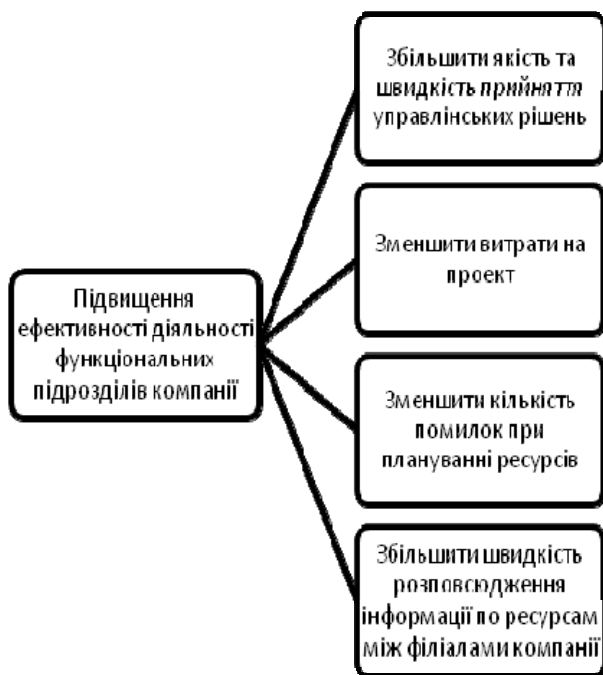
Рис. 1. Дерево цілей створення PRP-системи

Дерево цілей створення PRP-системи показано на рис. 1, функції – на рис.2.