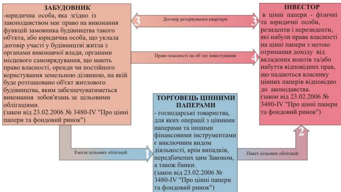
Рис. 2. Схема фінансування будівництва житла через емісію цільових облигацій

Купуючи деякі цільові облигації, інвестор отримує право через обумовлений термін обміняти цінний папір на право власності на житло. Одна з переваг облигаційної схеми – потрібний для отримання квартири пакет цінних паперів деякі забудовники дозволяють накопичувати поступово.