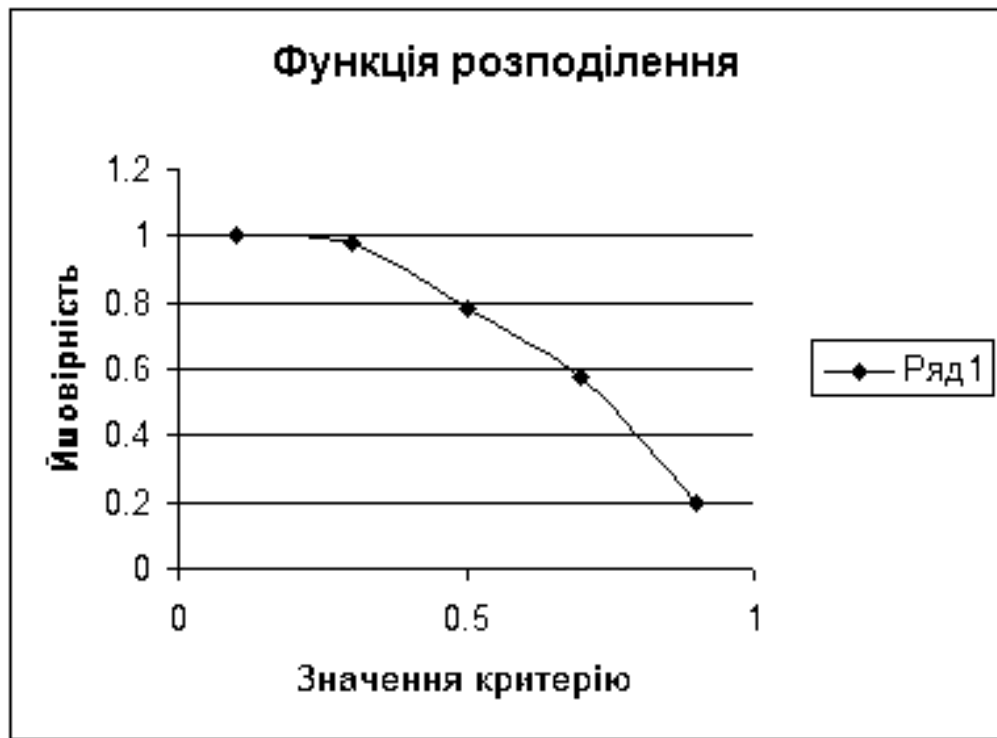
Рис.3. Функція розподілення

Надійність (ймовірність) досягнення бажаного значення V_{dc}^{(3)б} якісного рівня критерію, що має вигляд: P(V_{dc}^{(3)} \geq V_{dc}^{(3)б})