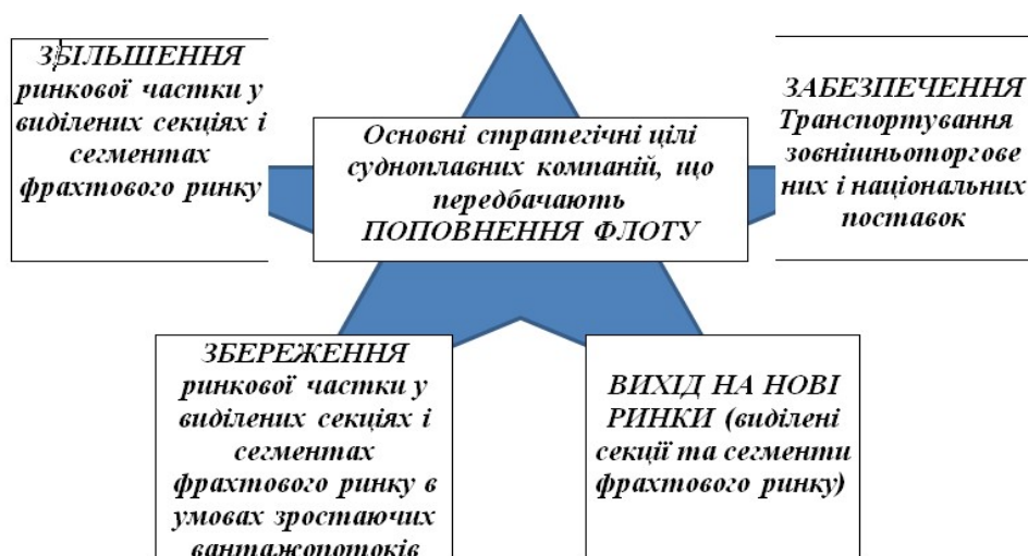
Рисунок 3 – Основні стратегічні цілі судноплавних компаній, що передбачають поповнення флоту (розроблено авторами)

Як відомо, у будь-якого підприємства виокремлюють такі види діяльності – інвестиційна, операційна та фінансова. Тому проєкти поповнення флоту пов'язані із здійсненням інвестиційної та операційної діяльності судноплавних компаній. Варіанти поповнення флоту та їх місце в системі діяльності судноплавної компанії подано на рис. 3.