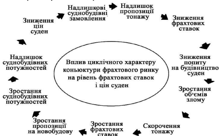
Рисунок 2 – Циклічність фрахтового ринку та її вплив на будівництво суден (розроблено авторами)