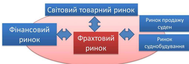
Рисунок 1 – Взаємозв'язок фрахтового ринку з іншими ринками (розроблено авторами)

З початком широкомасштабного вторгнення росії в Україну інфраструктура водного транспорту зазнала великих руйнувань та жертв з боку населення, як наслідок зруйнована економічна система. Для компаній, що працюють у сфері морських перевезень, в якості засобів виробництва виступають судна, сукупність яких формує флот компаній. Експлуатація морських суден може бути продовжена за допомогою їх модернізації. Відзначимо, що вік суден значно впливає на ефективність морських перевезень, а в деяких випадках і на саму можливість надання послуг перевезення. Так, правилами багатьох розвинених країн заборонено захід у порти суден, чий вік перевищує певний рівень. Тому навіть при наявному попиту на перевезення та його ціну, яка задовольняє судновласника, необхідність суднозаходу в порти із зазначеними вимогами змушує судновласника відмовитися від роботи. Пов'язано це з посиленими тенденціями забезпечення безпеки судноплавства не тільки на національному, а й на світовому рівнях. Отже, фрахтовий ринок, ринок продажу суден і суднобудування є тісно взаємопов'язаними ринками (рис. 1).