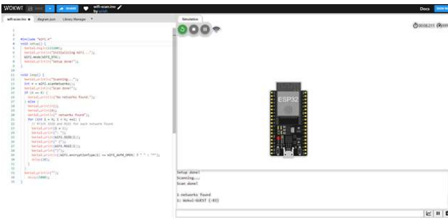
Рисунок 2 – Віртуальна модель точки доступу до Wi-Fi мережі на базі контролера ESP 32 в середовищі WokWi

У розробленому курсі «Основ робототехніки» особлива увага приділена самостійній роботі слухачів, у процесі якої пропонується самостійно ознайомитися з окремими питаннями інженерії програмного забезпечення робототехнічних систем. Організацію і планування самостійної роботи з вивчення цих питань проведено із застосуванням основ концептуального моделювання. Зокрема, розроблено методичний матеріал для ознайомлення та вивчення найбільш поширеної парадигми аналізу, проектування та програмування, в основі якої лежить об'єктно-орієнтований підхід [16]. Більшість сучасних RAD-середовищ (Rapid Application Development) побудовано з використанням саме такої концепції. У той же час, коли мова йде про розробку програмного забезпечення для мікроконтролерів на мові C, однозначної відповіді на питання про доцільність її застосування під час розроблення немає. У рамках наявних компромісних варіантів можна запропонувати спрощений підхід, для пояснення якого використовуємо таку концепцію.